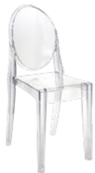
Stuhl CRISTAL Mietmobiliar, options.ch