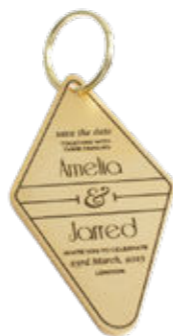
Schlüsselanhänger/Keychain Personalisierbar, etsy.com