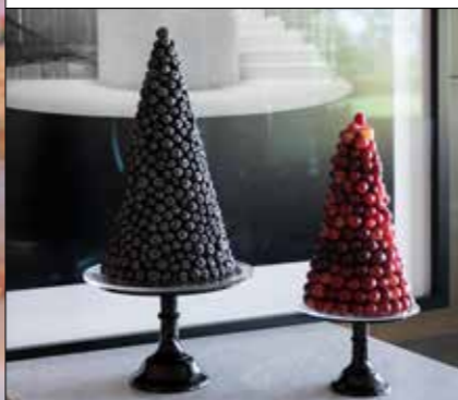
Wedding Cake mal anders Tortenmanufaktur & Confiserie, törtlifee.ch