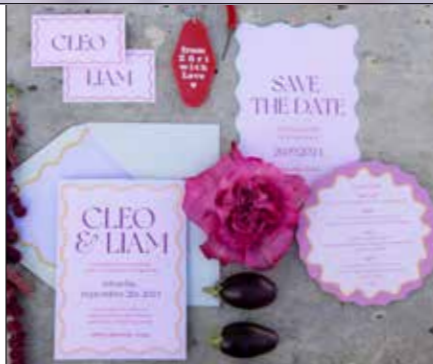
Hochzeits-Papeterie Blattpapier Studio, blattpapier.com