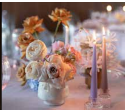
Soleas Blumen soleas.ch